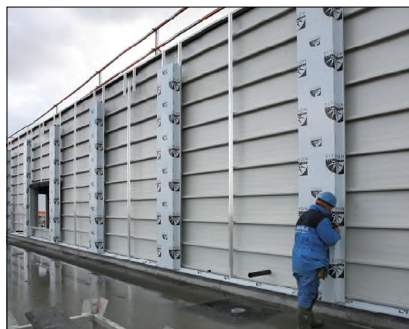
Het echte werk gebeurt op het project, gewaarborgd door de kwaliteitsrichtlijn en het keurmerk. Vanaf 2010 starten in vijf regio's specifieke monteursopleidingen volgens Dumebo-DWS-kwalificatieprofiel.

De kwaliteitsrichtlijn verschaft de markt sinds 2003 helderheid, terwijl het voor Dumebo-DWS-leden als verzameling voorschriften geldt. Het